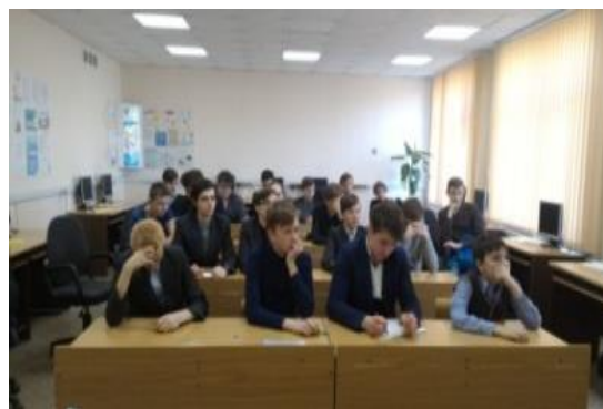
Вебинар «Технология работы по реализации проектов (практический опыт)»