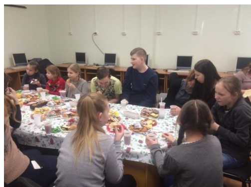
Женский день – 8 марта