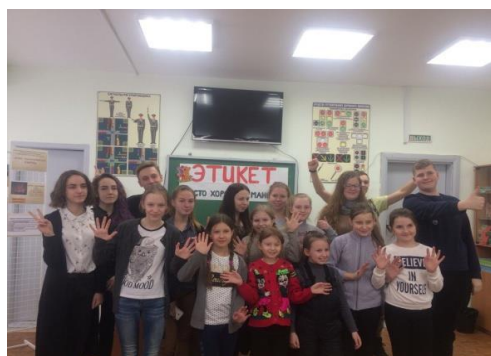
Этикет или хорошие привычки