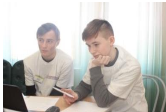
Финал Всероссийского конкурса научно-технологических проектов школьников