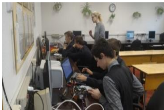
Знакомство с робототехникой