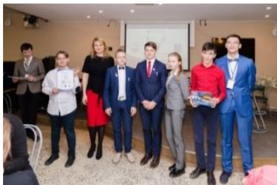
Финал Чемпионата по интеллектуальным играм «ПоЛЭТеЛИ с нами» среди школьников Ленинградской области