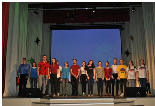
Творческая группа поддержки участников конкурса «Лидер»