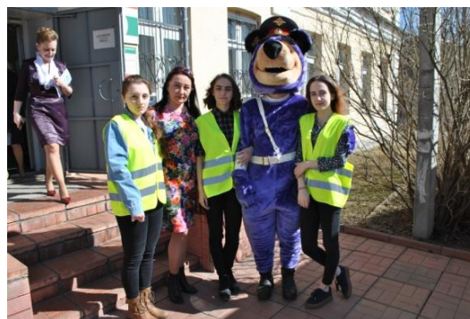
Волонтеры на празднике ПДД